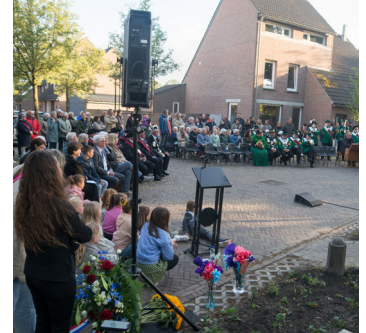
Impressie van dodenherdenking 2025.