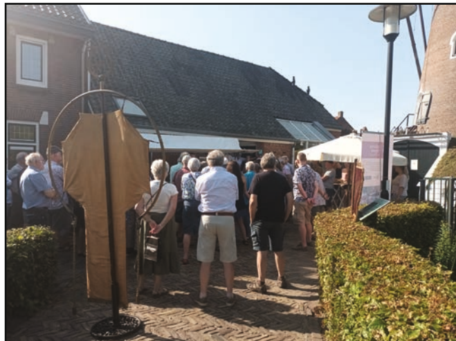
Flinke belangstelling bij de opening van de Open Monumentendag 2023 bij molen De Doornboom in Hilvarenbeek.